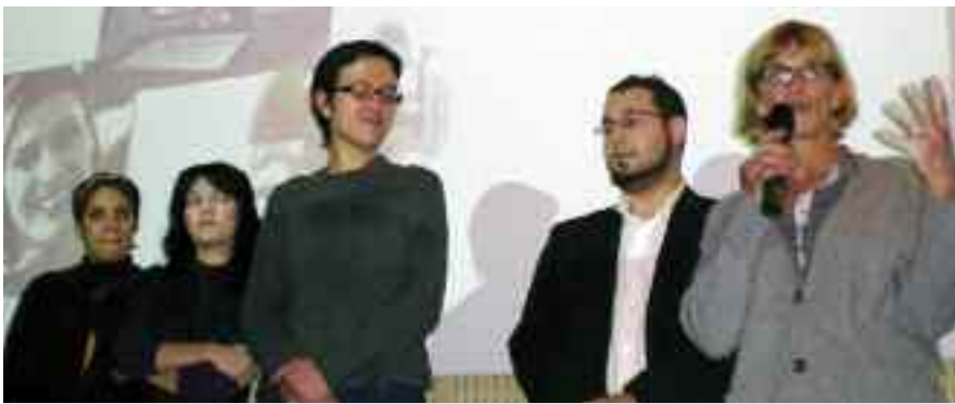
Une formatrice tertiaire et quelques uns des lauréats CCI &amp; Caux

Depuis la rentrée 2007, CCI & CAUX réunit les organismes de formation des Chambres de Commerce de Fécamp-Bolbec et du Havre, multipliant les passerelles pédagogiques et renforçant l'offre de formation auprès des entreprises du territoire. Pas moins de 250 d'entre elles ont participé cette année au processus de formation des 220 lauréats ayant décroché leurs diplômes ou certificats consulaires. Stages pratiques ou alternance, le lien étroit qui unit les entreprises aux programmes pédagogiques garantit l'adéquation de l'enseignement transmis par CCI & Caux avec les besoins réels du marché et permet d'anticiper leurs besoins en termes de ressources humaines : le taux moyen d'insertion est d'ailleurs de 80 % dans les six mois. Les 20, 24 novembre et le 11 décembre derniers se sont déroulées les cérémonies de remise des diplômes et certificats par pôles de compétences : commerce,