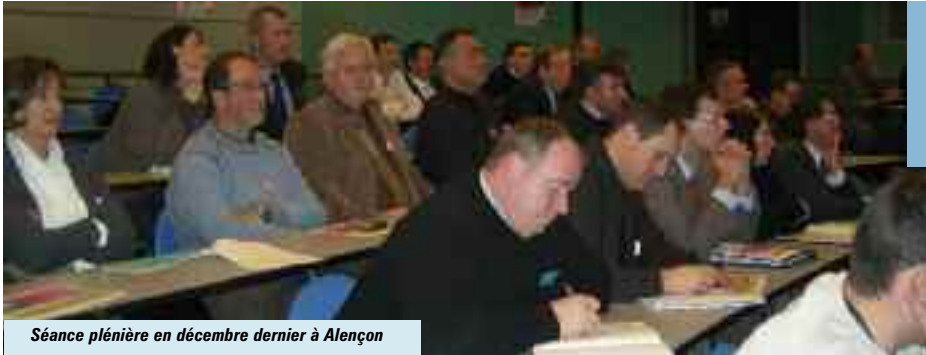
Séance plénière en décembre dernier à Alençon